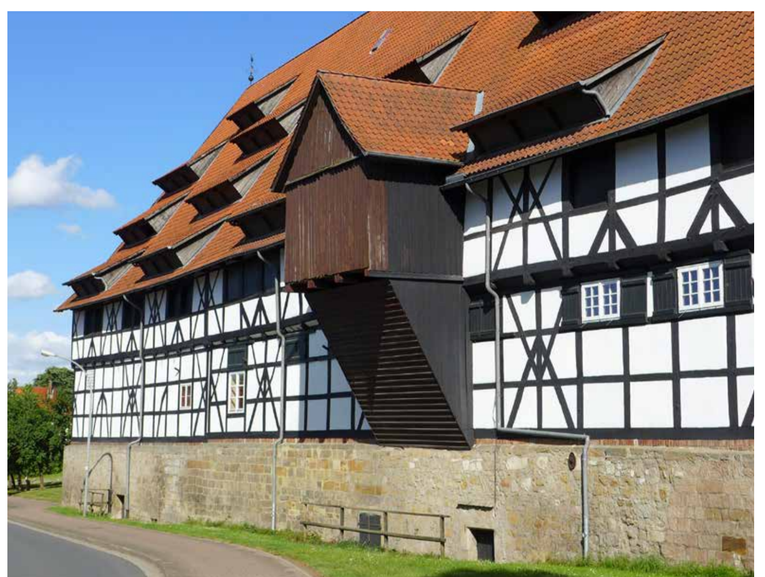
Ehemalige Domäne Liebenburg (Sandsteinsockel Ende 17. Jh.) Former Liebenburg Estate (sandstone foundations, late 17 th century)