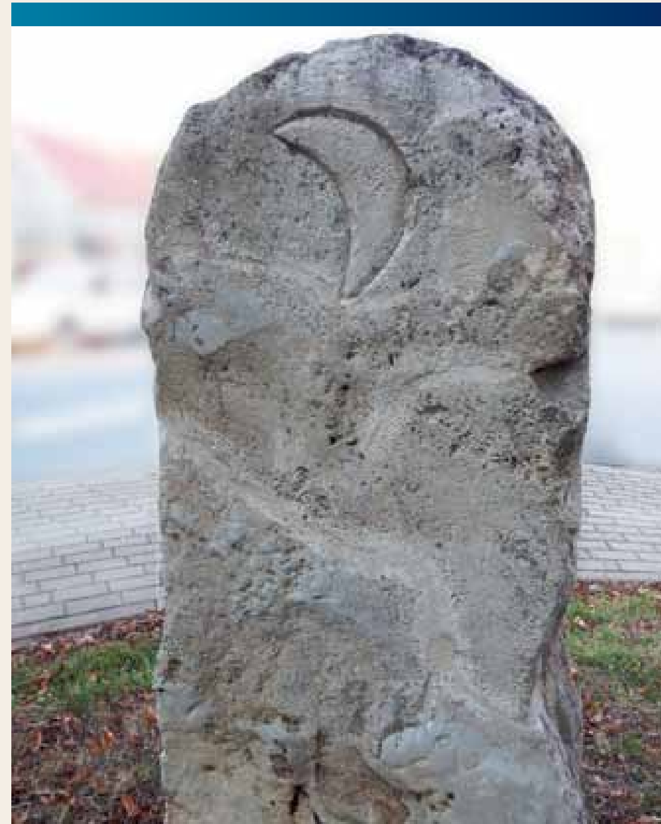
Halbmond aus dem Wappen derer von Bodenhausen; heutiger Standort des Grenzsteins: Großbodungen

(Rund- oder Vierecktürme aus Holz oder Stein) standen meist dicht an der Landwehr. Sie waren wichtige Beobachtungs- und Warneinrichtungen. Spezielle Gräben und ein erhöhter Zugang erschwerten den Zutritt. Noch dazu lag der Eingang meist ein paar Meter über