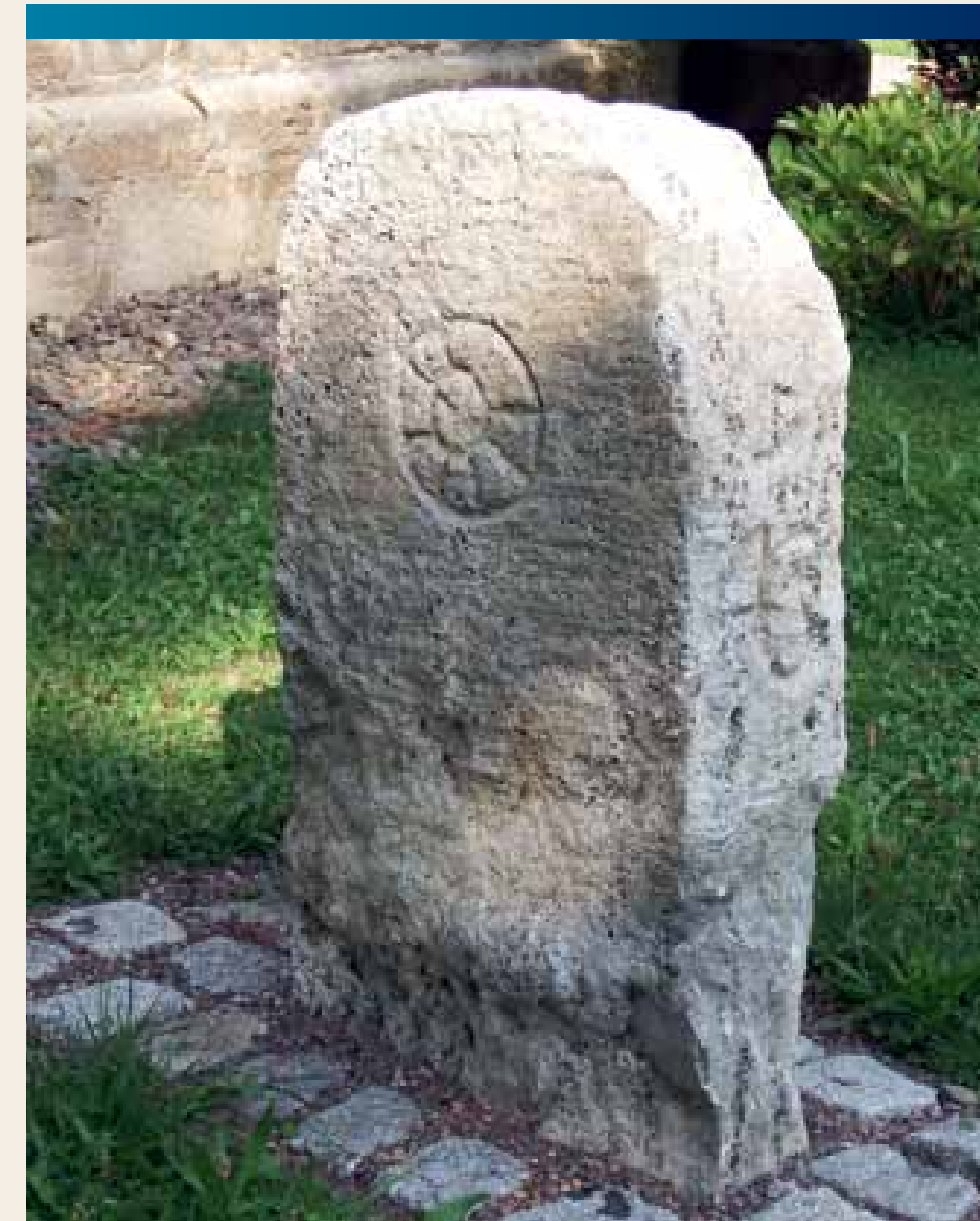
Mainzer Rad auf Grenzstein aus dem Rehunger Tal; heutiger Standort: Kirchgarten Wülfingerode

dem Boden, so dass dieser nur mit Leitern erreichbar war, die bei Gefahr hochgezogen werden konnten. Schlagbäume dienten nicht nur zum Schutz, sondern auch zur Kontrolle von Warentransporten und zur Erhebung von Zoll- und Wegegeld.