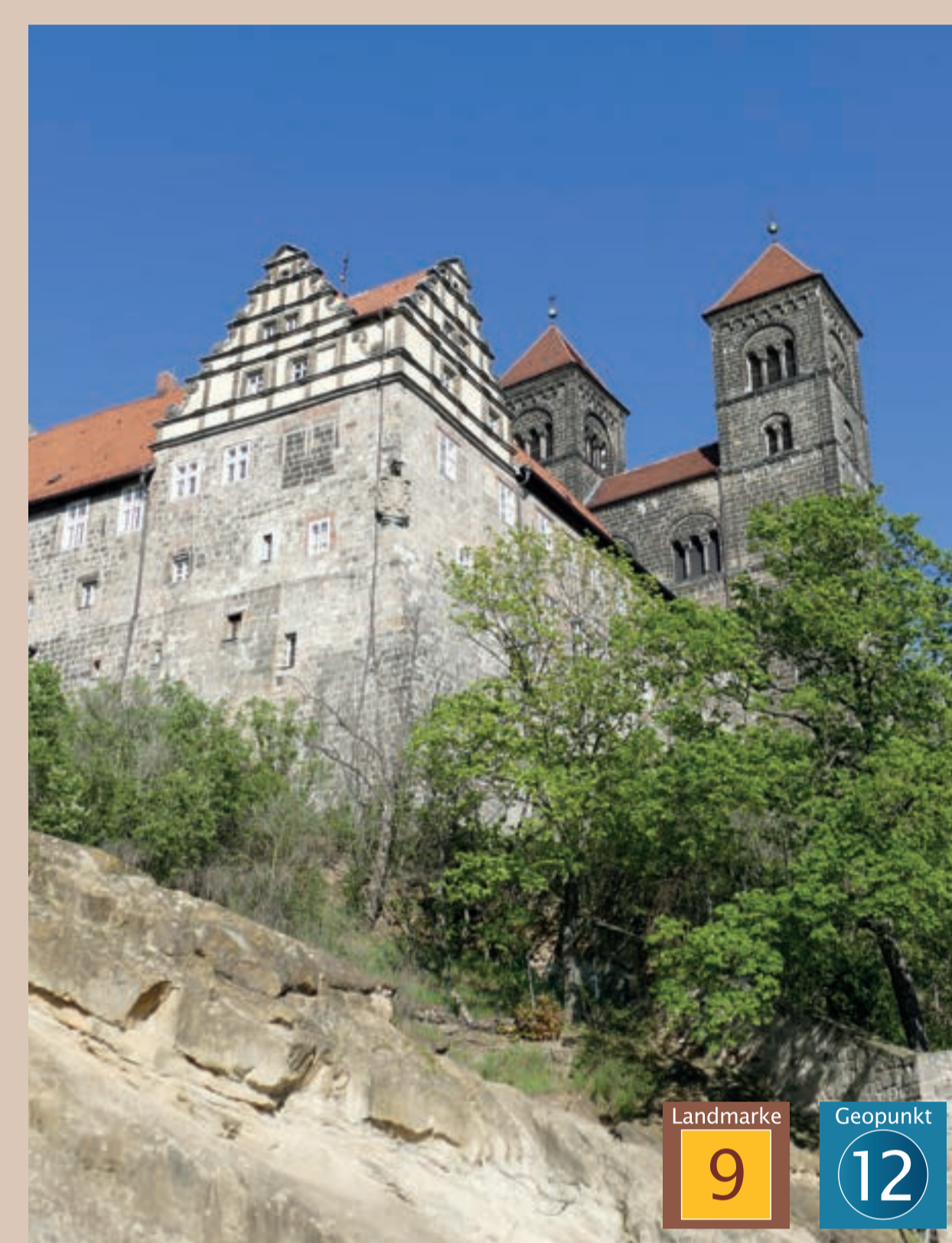
Sandsteinklippen Schlossberg Quedlinburg Sandstone Cliffs Schlossberg Hill Quedlinburg

Covering an area of 9,646 km 2 , the borders of the Geo-park extend well beyond those of the Harz Nature Park. Geoparks were originally conceived as areas containing concentrations of geotopes. The term geotope encom-passes rock outcrops and special terrain forms which provide insights into the evolution of our planet. As a result we call them „windows into the history of the Earth“. Over time Geoparks have become clearly defined areas. Administering or-ganisations, such as the Regionalverband Harz, function to protect geo-logical heritage, promo-te regional development, and offer educational op-portunities in the field of sustainable develop-ment. These duties and responsibilities are virtu-ally identical to those of organisations which ad-minister nature parks.