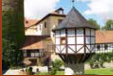
Hotel & Spa Wasserschloss Westerburg www.hotel-westerburg.de ☎ 039422 - 9550