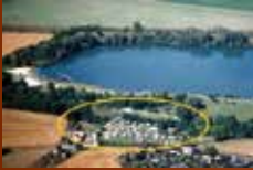
Camping am Halberstädter See www.camping-am-see.de ☎ 03941 - 609308