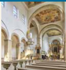
Innenansicht Kirche St. Maria

Bestand und ist Station der Straße der Romanik. Im Ekkehard-Haus des Klosters, einem Tagungs- und Gästehaus, werden die Gäste unter dem Motto „Gastfreundschaft seit 1.000 Jahren“ empfangen. Die höchste Erhebung des Huy erreicht 314,8 m über NHN. Der Huy selbst ist ebenso wie die bewaldeten Höhen von Hakel und Fallstein ein weit gespannter Muschelkalkrücken. Diese Kalkrücken entstanden im Ergebnis langsamer Aufwärtsbewegungen des tief im Untergrund lagernden, mehrere hundert Meter mächtigen Salzes der Zechsteinzeit. Probebohrungen im Huy im 19. Jh. führten zur Entdeckung einer abbauwürdigen Kalilagerstätte. Die Gewerkschaft Wilhelmshall zu Anderbeck begann 1889 mit der Abteufung des ersten Schachtes „Wilhelmshall I“. 1895 beträgt die jährliche Fördermenge bereits 112.000 t Kalisalz. Mit der Schließung der Bergwerke im Huy 1924–26 verloren über 1.000 Bergleute ihre Arbeit.