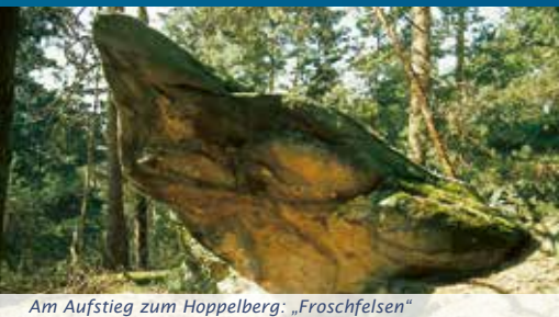
Am Aufstieg zum Hoppelberg: „Froschfelsen“