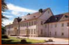
Ekkehard-Haus Huysburg www.huysburg.de ☎ 039425 - 961300