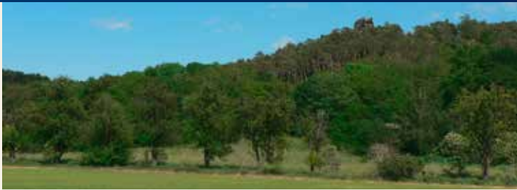
Blick zum Aussichtspunkt Gläserner Mönch

Vom Gläsernen Mönch aus ist es nicht weit bis zur Gedenkstätte Langenstein-Zwieberge. In den Jahren 1944/45 leisteten dort tausende Häftlinge unter unmenschlichen Bedingungen Schwerstarbeit. Zur Untertageproduktion von Rüstungsteilen der Junkers Flugzeug- und Motorenwerke AG mussten die Häftlinge ein Stollensystem in den Thekenbergen anlegen. Heute hält ein Verein das Andenken mit verschiedenen Projekten aufrecht.