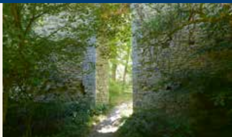
Wehrmauer der Domburg