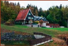
Jagdschloss Windenhütte Altenbrak www.jagdschloss-windenhuette.de ☎ 039456 - 233