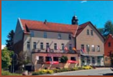
Hotel Restaurant Druidenstein Trautenstein www.hoteldruidenstein.de ☎ 039459 - 739494