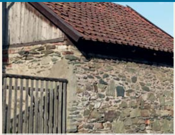
Vulkanite bzw. Schalstein als Baumaterial