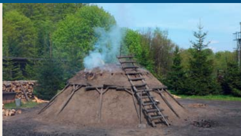
Meiler im Aufbau