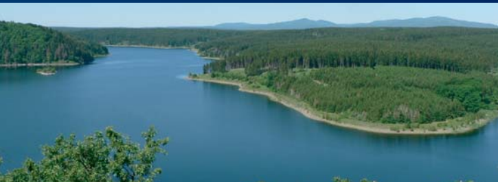
Blick vom Roten Stein auf die Rappbodetalsperre

Die Rappbodetalsperre als Hauptstauwerk des Talsperrensystems ist mit ihrer 415 m langen und 106 m hohen Mauer ein beeindruckendes Objekt der Wasserbaukunst. Sie erreicht bei Vollstau (über 109 Mio m 3 ) eine Wasserfläche von 390 ha. Die nach Schneeschmelze und/oder hohen Niederschlägen immer wieder auftretenden Überschwemmungen brauchen die Bode-Anrainer im Harz und Vorharz seit 1958 kaum noch zu fürchten. Trinkwasser wird seither von der Rappbodetalsperre weit bis in den mitteldeutschen Raum geliefert. Zum Talsperrensystem gehören die Vorsperren von Rappbode und Hassel, die Überleitungssperre bei Königshütte, die Mandelholztalsperre, das Pumpspeicherwerk Wendefurth und der für touristische Nutzung freigegebene Stausee Wendefurth.