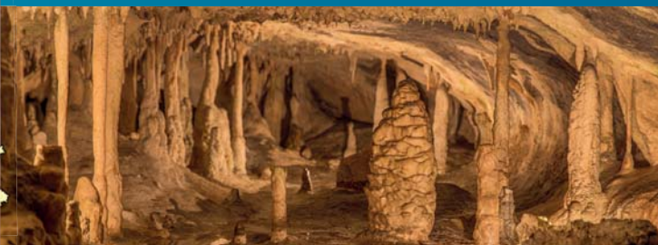
In der Hermannshöhle

Die Baumannshöhle gilt als älteste Schauhöhle Deutschlands. Bereits seit 1649 werden hier Gäste geführt. Auch JOHANN WOLFGANG VON GOETHE (1749 – 1832) faszinierte deren Schönheit. Bis heute haben die Tropfsteine nur wenig von ihrem Reiz verloren. Die verschiedenen Formen der Gebilde, die sich seit zehntausenden von Jahren aus dem vom versickernden Niederschlagswasser gelösten Calcium bilden, entstehen durch Kristallisation. Deckenzapfen (Stalaktiten) entstehen aus herabtropfendem Wasser. Die Bodenzapfen (Stalagmiten) wachsen ihnen entgegen, sie bilden sich aus den Aufschlagswässern. Nach dem Zusammenwachsen beider Formen sprechen wir von Stalagnaten. An den Höhlenwänden hingegen bilden sich Sintergalerien. Der 2.500 m 2 große Goethe-Saal mit seinem künstlichen Wolfgang-See wird für Höhlenfestspiele genutzt. Im Empfangsgebäude ist