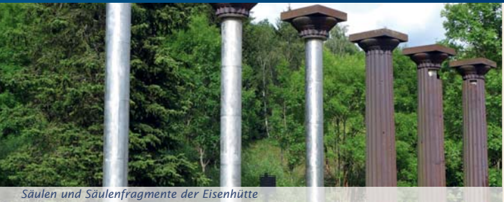
Säulen und Säulenfragmente der Eisenhütte

Ursprünglich war der Harz Königsgut. Über die bedeutende Grundherrschaft verfügte das Geschlecht der Liudolfinger („Ottonen“). Ihr Erbe traten die Salier an, die den an Rohstoffen reichen Harz durch einen Ring von Burgen zu schützen versuchten. Doch im Reich rumorte es. Fürsten scharten Aufständische gegen das Königtum um sich. Östlich des Harzes, in der Schlacht am Welfesholz, fügten sie HEINRICH V. 1114 eine vernichtende Niederlage zu. Die Zentralherrschaft im Harz war gebrochen. Unter rivalisierenden Grafengeschlechtern kam es zu einer territorialen Zersplitterung.