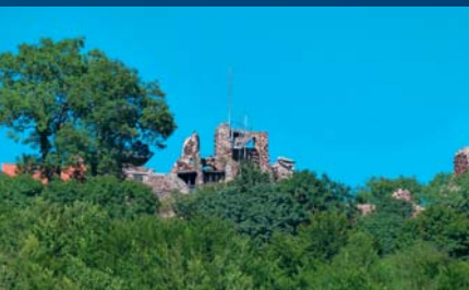
Blick zur Burgruine Hohnstein

Oberhalb des Luftkurortes Neustadt befindet sich die Ruine der Anfang des 12. Jh. erbauten ehemaligen Grafenburg Hohnstein. Sie war im 30-jährigen Krieg zerstört worden, ist aber auch heute noch eine der größten und beeindruckendsten Burganlagen im Harzgebiet. Die Burg befindet sich mitten im Verbreitungsgebiet des Ilfelder Rhyoliths (Porphyrit) auf einem felsigen Bergsporn. Dementsprechend wurde vorwiegend der dunkelrotbraune Porphyrit als Baumaterial verwendet. Der natürliche Untergrund, der „gewachsene Fels“ und das von Menschen errichtete Bauwerk bestehen überwiegend aus dem gleichen Material; die Mauern und Gebäudereste erscheinen gleichsam als selbstverständliche Fortsetzung der natürlichen Felsformationen. Neben dem Porphyrit haben aber auch verschiedene andere Gesteine, vor allem der heimische Gips, als Baumaterial Verwendung