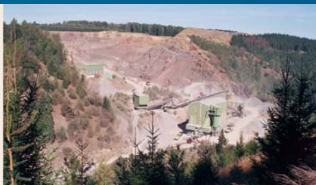
Blick in den Steinbruch Unterberg

und als Grauwacke vor. An den steilen submarinen Rändern des Festlandes kam es in Verbindung mit Erdbeben immer wieder zum Abrutschen der noch unverfestigten Ablagerungen. In diesen Prozess waren teilweise auch bereits verfestigte ältere Gesteine einbezogen. Die Schlammströme führten zur Verfrachtung und Umlagerung von ganzen Gesteinspaketen bis zur Entfernung von 25 km von der Mitteldeutschen Kristallinschwelle nach Nordwesten. Als Teil einer solchen Gleitscholle erreicht die Südharzgrauwacke eine Mächtigkeit von 400 bis 500 m.