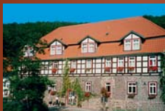
Hotel „Hohnstein“ Neustadt/Südharz www.hotel-hohnstein.de ☎ 036331 - 46718