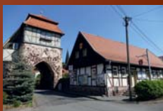
Neustadt-Information Neustadt/Südharz www.neustadt-harz.de ☎ 036331 - 46277