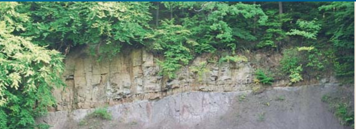
Nationaler Geotop: Lange Wand bei Ilfeld

Die „Lange Wand“ südlich von Ilfeld ist über eine innerörtliche Straße vom Haltepunkt „Ilfeld Schreiberwiese“ der Harzquerbahn aus zu erreichen. Der Steilhang am Ostufer der Bere ist ein klassischer geologischer Aufschluss, wo magmatische Gesteine (Ilfelder Porphyrit) des Rotliegenden von den Ablagerungen des Zechsteinmeeres überlagert werden. Nach der Herausbildung des Harzes als Gebirge entstanden in der Permzeit vor ca. 300 Mio. Jahren durch Vulkanausbrüche mächtige Lavaschichten. Durch die ständig wirkenden Kräfte der Verwitterung wurde das Land danach völlig eingeebnet und vor etwa 255 Mio. Jahren erneut vom Meer überflutet. Es begann die Zechsteinzeit. Am Strand des Zechsteinmeeres wurden Sand und Geröll angespült. Das Meer drang allmählich weiter in das Landesinnere vor, wurde tiefer, und es bildete sich schwarzer Schlamm mit wertvollen