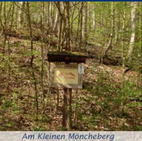
Am Kleinen Möncheberg

Von Ifeld aus führt ein ca. 3,5 km langer ausgeschilderter Wanderweg zum Braunsteinhaus. Mit dem Fahrzeug erreichen wir den Ort von der Ortsverbindungsstraße Ifeld – Appenrode aus über einen befestigten Fahrweg. Das Braunsteinhaus ist das ehemalige Zechenhaus des hier wohl bereits im Mittelalter, bergmännisch fachgerecht seit Anfang des 18. Jh. betriebenen Manganerzbergbaus. Braunstein ist eine alte bergmännische Bezeichnung für derbe braunschwarze Manganerze. Mangan war schon im Mittelalter ein gesuchter Rohstoff. Die im Harz verbreiteten Venezianersagen gehen vermutlich auf Prospektoren (Fachleute, die Bodenschätze erkunden) aus Venedig zurück, die hier nach dem sehr hochwertigen Braunstein suchten. Venedig war seit dem frühen Mittelalter das Zentrum der europäischen Glasmacherkunst. Eines der dort gehüteten