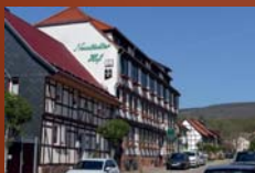
Hotel „Neustädter Hof“ Neustadt/Südharz www.neustaedter-hof.de ☎ 036331 - 9090