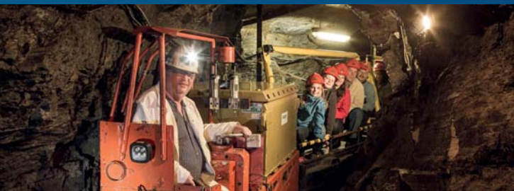
Besucherbergwerk Rabensteiner Stollen

Während die bekannten deutschen und europäischen Steinkohlenvorkommen im Oberkarbon gebildet wurden, sind die Steinkohlen des Harzes Bildungen des Perms. Nach der Herausbildung des variszischen Gebirges in der Zeit des Perms vor ca. 300 Mio. Jahren herrschte in diesem jungen Gebirgsland ein warmes, trockenes Klima. Die Kräfte der Verwitterung begannen ihr zerstörerisches Werk unmittelbar nach dem