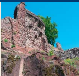
Auf Fels gebaut

gefunden. Seine Bedeutung liegt vor allem in der Verwendung als Mörtel, wie überall in den weißen Fugen erkennbar wird. Sie verleihen der Burg in schönem Kontrast zu dem dunkelbraunen Porphyrit ihr charakteristisches Gesicht. Ebenfalls massenhaft ist gebrannter Gips für die Herstellung der Estrich-Fußböden benutzt worden. Auch deren Reste sind vielerorts auf der Burg zu entdecken. Gelegentlich wurde der Gips (Alabaster) auch als Werkstein für besonders feine Arbeiten eingesetzt. Daneben sind in geringerem Umfang wohl nahezu alle in der näheren Umgebung verfügbaren Gesteinsarten beim Bau oder bei Ausbesserungsarbeiten der Burg verwendet worden. Bei einem Gang durch das Burggelände sollten wir nicht nur das alte Gemäuer im Auge haben: Vom Burghof oder noch besser vom Bergfried aus bietet sich ein umfassender Rundblick über weite Teile der alten Grafschaft. Bei klarer Sicht sind der Kyffhäuser, die Hainleite, das Eichsfeld und der Ravensberg zu sehen.