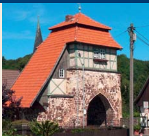
Altes Tor Neustadt

Es sind drei Kohleflöze mit einer Gesamtmächtigkeit der Kohle von 25 bis 70 cm ausgebildet. Die letzte zusammenhängende Betriebsperiode dauerte bis 1862. Die Einstellung des Bergbaus erfolgte aus einer Gemengelage heraus: teure Wasserhaltung und fehlendes Kapital für Investitionen ebenso wie langsame Erschöpfung der Vorräte. Ein vom Lönsparc aus als Naturlehrpfad beschilderter 6,3 km langer Rundweg führt an Sachzeugen des Bergbaus vorbei, so am „Stollenborn“ – der ehemaligen Wasserhaltung des Steinkohlenreviers in der Nähe des Grillplatzes Zapfkuhle, an Geländeeinschnitten der Zuwegungen zu den früheren Stollenmundlöchern oder an den ehemaligen Tagebauen am Südosthang des Vatersteins. Die Tagebaue zeigen sich heute als bis zu 3,5 m tiefe Senken. Das letzte Stück des Rundweges führt durch Neustadt. Wie für die Burg Hohnstein fand der dunkelrotbraune Porphyrit Verwendung als Baumaterial des dortigen Alten Tors. Unweit vom Alten Tor markiert eine deutliche Schwelle den Übergang in das Zechsteingebiet des südlichen Harzvorlandes.