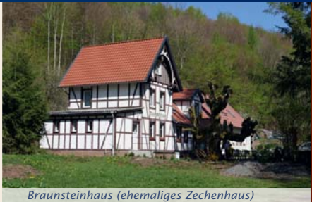
Braunsteinhaus (ehemaliges Zechenhaus)

Geheimnisse war das Verfahren zur Herstellung von farblosen Gläsern, zu deren Produktion ein Zusatz von Manganoxid erforderlich war. Neben den Manganerzen wurde im Gräflich Stolberg-Hohnsteinschen Forst auch Eisenerz abgebaut. Der Manganerzabbau wurde zunächst bis zum Jahr 1890 betrieben und dann wegen Erschöpfung der Lagerstätte eingestellt. Ab 1916 folgte eine zweite Bergbauperiode, die im Jahr 1922 mit der Stilllegung des Ifelder Manganerzbergbaus endete. Vom Braunsteinhaus aus starten wir unsere ca. 2 km lange Rundwanderung auf dem Lehrpfad im ehemaligen Manganerzbergbaurevier. An zwölf Stationen sind verschiedene Sachzeugen des Bergbaus in Form von Halden, steilwandigen Tagebauen, Pingen und verbrochenen Stollenmundlöchern zu sehen. Diese stammen überwiegend aus der letzten Betriebsperiode während des Ersten Weltkrieges.