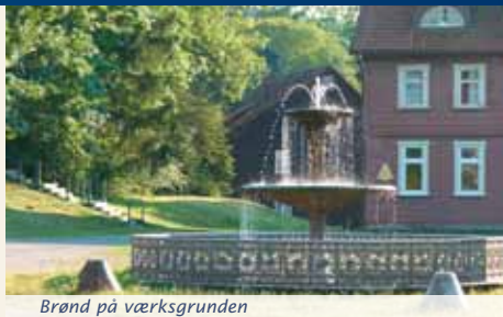
Brønd på værksgrunden

lagt i 1983) åbne jernværksmuseet "Südharzer Eisenhüttenmuseum" i det tidligere analyselaboratorium. I museets to rum gives der indblik i jernsmeltningens grundlag, jernværkets funktion og det alsidige produktprogram. Udstillingen fokuserer især på støbejernskunst.