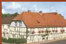
Landhaus Schulze Herzberg am Harz www.landhaus-schulze.de ☎ 0049 5521 - 89940