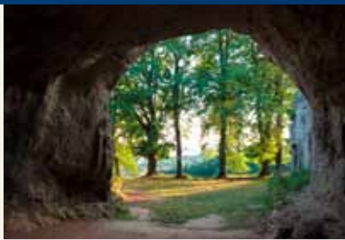
Stenkirken i dag

pladsen har været bebygget. Fra det 9./10. til 15. århundrede blev forpladsen brugt som kirkegård til mere end 100 mennesker. Under prædikestolen blev der i 1937 fundet et skelet af en kvinde i en "stenkiste", der til dels er hugget ind i dolomitklippen. Stenkirkens klokke fra 1433 lyder i dag i den neogotiske landsbykirke i Scharzfeld. Steinbergs fremspring over Oderdalen har spor af en middelalderlig befæstning med vold og grav. Her tændes hvert år påskebålet, som bringes i forbindelse med sagnet om hændelserne ved kristianseringen af de hedenske saksere.