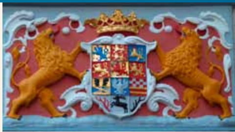
Hertug Georg Wilhelms våbenskjold

underlaget af dolomit og gips kraftigt. Forvitret flodgrus på slotsbjerget indikerer, at Sieber løb over dette niveau ved begyndelsen af istiden. Floden er siden sunket kraftigt.