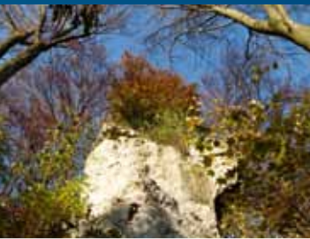
Dolomit uden lagdeling

Da Zechsteinhavet oversvømmede området for 258 mio. år siden, dannede en langstrakt højderyg, Eichsfeld-forhøjningen, først en halvø og senere et lavvandsområde med bugter og øer. Lavvandsområder muliggjorde væksten af tropiske rev. Sydharzen lå i et varmt klima omtrent der, hvor Kairo ligger i dag. Atlanterhavet fandtes ikke endnu. Amerika lå vest for Zechsteinhavet, som hurtigt trængte ind fra nordvest. Tørt varmt klima, klart vand og mange opløste stoffer fremmede væksten af kolonidannende organismer. Deres konstruktioner formede rev af organisk kalk fra havbunden til overfladen.