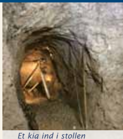
Et kig ind i stollen