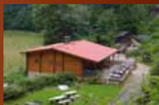
Haus Einhorn Scharzfeld Herzberg am Harz www.wanderbaude.de ☎ 0049 5521 - 997559