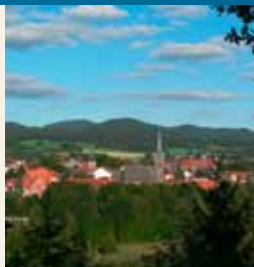
Udsigt til Herzberg

Grundvandet dannede små huler i kalken, hvor der dannede sig bløde manganmalme. For at give sygehuset et stabilt fundament på denne varierende jordbund var det nødvendigt at banke 230 betonpæle i jorden.