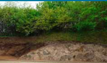
Blotning ved Herzberg

Da sygehuset blev bygget, stødte man på vanskelige forhold i undergrunden, som giver et godt indblik i forløbet af Jordens historie. En porfyrgang, dvs. halsen fra en vulkan, kan ses på skrænten bagerst på parkeringspladsen. I Rotliegendes-epoken (for ca. 270 mio. år siden) blev der dannet en 25 m dyb og op til 80 m bred stejl slugt i gråvækkeklipperne. Senere fyldte det fremrykkende Zechsteinhav slugten op med aflejringer, hvis nederste aflejring er det ca. 40 cm tykke kobberskiferlag. Zechsteinhavets levende organismer fyldte resten af hullet op med kalkslam, som i dag udgør Zechsteinkalken. Den bløde kalkslam skred ned ad den skrånende havbund og blev foldet sammen foran forhindringer, som det kan ses her foran porfyrgangen. I den tidlige istid skar floden Lonau sig gennem kalkstenen og fyldte den herved opståede dal med sand og grus.