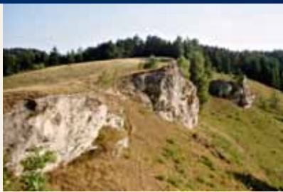
Landskab på Karstvandrevejen

Fra Förste til Ellrich er der endda to parallelle ruter! Omkring 200 informationstavler fortæller om geologi og landskab, miljø- og naturbeskyttelse, grundvand og bebyggelses- og industrihistorie. Vejen fører forbi talrige kulturmindesmærker, f.eks. slotte, borgruiner og kirker, samt naturmindesmærker. Desuden krydser den mange naturreservater. Man kommer også forbi iscaféeer, svømmehaller, besøgshuler, hoteller, landsbykroer, campingpladser og vandrehjem.