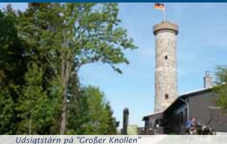
Udsigtstårn på "Großer Knollen"

I Rotliegendes-epoken (Tidlig Perm), efter Harzens foldning og hævnning over havet i Sen Karbon, startede en vulkansk aktivitet. Revner i de nydannede gråvakkedjerge fyldtes med glødende, smeltet magma, der blev transporteret op til overfladen. Magmaen størkede til porfyr (rhyolit), en bjergart, der i dag har en svag lilla til lyserød farve. "Großer" og "Kleiner Knollen" nordøst for Herzberg er sådanne porfyrvulkaner. Begge er vellidte vandremål. På vej til restauranten Knollenbaude (687 over havets overflade) kan vi se flere porfyrfyldte revner. Deres lavastrømme er i dag eroderet væk igen. I godt vejr kan man fra toppen af "Großer Knollen" se til "Großer Inselsberg" i "Thüringer Wald".