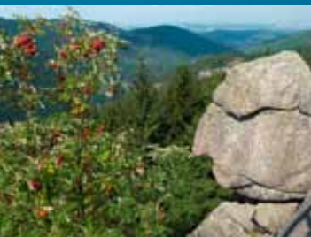
Den gamle mand fra bjerget

Fra parkeringspladsen ved kraftværket går vi op ad den stejle sti på venstre side af det kunstige Romkerhalle-vandfald og tager stien "Schöppenstedter Weg" – "Romkerkopfweg" – "Klippenweg" i retning af Kästehaus (ca. 3 km). Vi når først til "Feigenbaumklippe" (Figentræsklippen), hvor en stabel granitblokke har dannet en lille hule. Gennem millioner af år har eroderende kræfter fritlagt taget af Okergranit. Granitten nedbrydes gradvis til mindre afrundede blokke. Efter at have passeret "Mausefalle" (Musefælde) og "Hexenküche" (Heksekøkken) når vi til toppen af Huthberg (605 m over havets overflade). Lidt nedefor ligger restauranten. På toppen bærer en klippe det meget passende navn "Der Alte vom Berge" (Den gamle mand fra bjerget). En komfortabel sti fører os via "Treppenstein" (Trappesten) tilbage til dalen (ca. 5 km).