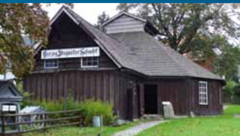
Museets udendørs område

Museet blev grundlagt i bydelen Zellerfeld i 1892, efter at minechef ADOLF ACHENBACH (1825 – 1903) havde taget initiativ til at samle og bevare historiske minemaskiner. Museet omfatter en besøgsmine med en ca. 250 m lang stolle og originale mineanlæg. Hertil hører Tysklands eneste bevarede hestegang, der er blevet anvendt i forbindelse med minedrift, det eneste stampeværk til forarbejdning af malm og skaktbygningen fra 1787. I hovedbygningens 30 udstillingslokaler giver en modelsamling, mineral- og møntsamlinger og en specialsamling om minelamper og arbejdsredskaber et samlet overblik over Oberharzens minehistorie siden middelalderen. Dette inkluderer også et kig ind i minebyens borgerlige boligkultur. På første sal, som oprindeligt blev brugt til beboelse, er der indrettet en bolig, som den kunne have set ud dengang. Udstillingen