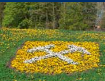
Clausthal-Zellerfeld siger det med blomster

Clausthals kulmfoldebælte indtager størsteparten af det nordvestlige Oberharzen i området omkring landmærke 2 . Den består hovedsageligt af vekslende lag af gråvækker og skiferler fra den underkarboniske kulm. Disse lag ligger umiddelbart over de underliggende devoniske sedimenter og er blevet afsat i det Rheiske Ocean, hvortil der strømmede mudder fra det omliggende fastland. Sorteringen af sedimenterne – den graderede lagdeling – viser tydeligt denne proces: Først blev det tunge grove materiale afsat, så lidt efter lidt det lettere finmateriale og til sidst lerminerallerne, som senere udviklede sig til skiferler. Slibemærker på havbunden, som har overlevet i millioner af år, gør det muligt at rekonstruere mudderstrømmenes transportretning. De kom fra et højtliggende område, der lå syd eller sydvest for Harzen. Planterester i sedimenterne dokumenterer vegetationsforholdene i Tidlig Karbon.