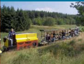
Tur med minetoget

Indtil Preussag stoppede minedriften i Clausthal-Zellerfeld i 1930, var Ottiliae-skakten hovedskakten til Rosenhöfer-, Burgstätter- og Zellerfelder-gangene. Malmen (især sølvholdig blyglans og zinkblende) blev først transporteret med både ad en underjordisk vandvej, hørende til Ernst-August-stollen, op til 6 km væk fra brydningsstedet. I Ottiliae-skaktens havn, der ligger 341 m under jorden, blev transportkasserne fastgjort til ståltov. De blev så løftet ud af bådene og