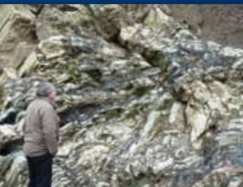
Blotning i Kellwassertal

Vi kører videre gennem dalen og når til den opdæmmede Okersø, hvor vi kører over broen Weißwasserbrücke i retning af Altenau. Vi parkerer på søens dæmning og går langs muren til Kellwassertal til de verdensberømte aflejringer. Her blev to klippelag, som findes overalt i verden og hænger sammen med en af de største masseudryddelser i Jordens historie, beskrevet første gang. De opragende kalk- og lerskiferklipper vidner om en katastrofe i Sen Devon, der internationalt er kendt som Kellwasser-krisen. Krisen varede flere 100.000 år og var præget af store økologiske forandringer. Ca. 75 % af alle former for liv blev udslettet, bl.a. de devoniske rev. På trods af intensiv forskning kender man stadig ikke årsagerne til denne krise og de tilgrundliggende klimatiske betingelser.