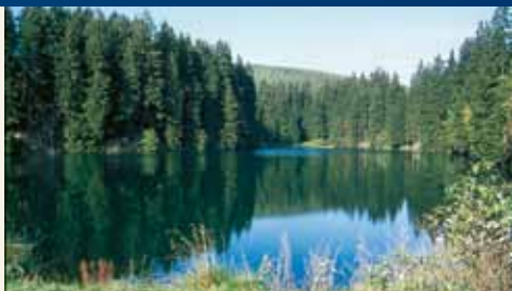
Unterer Schalker Teich (Nedre Schalke Dam)