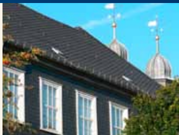
Mineinspektoratet på Silberstraße