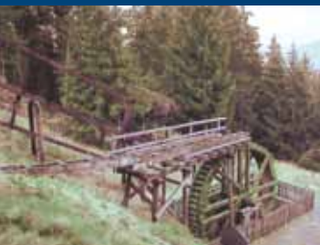
Maaßener Gaipel (trædemølle)

Tilbage i Lautenthal drejer vi fra centrum mod højre i retning af Hahnenklee-Bockswiese. Vejen går op ad bakke, og der ses et stort slaggeområde på højre hånd. I den øverste ende af slaggebjergene følger vi en vej mod højre, der kurver tilbage og bringer os til Waldgasthaus (restaurant), der ligger højt oppe over Lautenthal. Her befinder vi os midt i et seværdigt minelandskab med mineindgange, slaggebjerge og "hulsten" (grænsesten). På vandrestien er der specielle informationstavler. På slaggebjergene finder man ofte zinkblende. For at undgå erosionsskader og beskytte den sjældne tungmetalvegetation er det på nogle af slaggebjergene forbudt at samle mineralerne. Den nedersaksiske skovmyndighed og Harzenklubben udførte i 2004 en omfattende vedligeholdelse af hele Geopunkt-arealet.