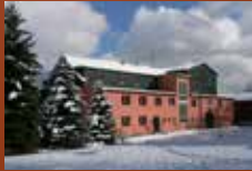
Berghotel Roßtrappe Thale www.berghotel-rosstrappe.de ☎ 03947 - 3011