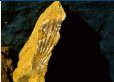
Fossile Muschel vom Salzberg