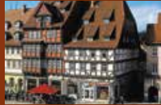
Hotel Theophano Quedlinburg www.hotel-theophano.de ☎ 03946 - 96300