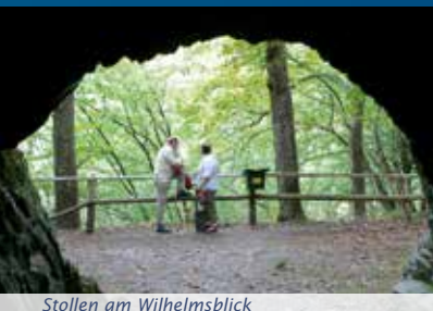
Stollen am Wilhelmsblick

Entlang der Straße treten in schiefrieger Matrix sehr große Gesteinsbrocken auf. Diese untermeerischen Rutschmassen (Olisthostrome) entstanden zu Beginn der Gebirgsbildung.