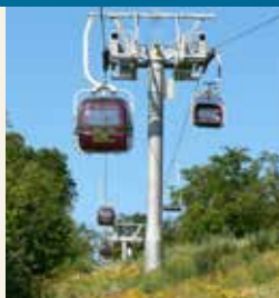
Sessellift zur Roßtrappe

Der Roßtrappenfels besteht überwiegend aus Granit. Dieser wird von verschiedenen starken Quarzadern durchzogen, was an mehreren Stellen gut erkennbar ist.