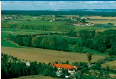
Blick von der Teufelsmauer zum Helsunger Krug