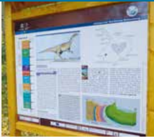
Am Geologischen Wanderweg

Am früheren Zisterzienserkloster Michaelstein beginnt ein Rundwanderweg. Dieser verbindet verschiedene geologische Aufschlüsse, die z. T. im Ergebnis der wirtschaftlichen Aktivitäten des Klosters entstanden. So soll sich am Oberlauf des Klosterbachgrabens eine Ziegelei befunden haben, die Tonvorkommen des Buntsandsteins u. a. zu Mönch & Nonne (historische Dachziegel in Form halbiertes Tonröhren) verarbeitete. Das von dort 800 m weiter entfernt gelegene Heilschlammbergwerk „Teufelsbad“ wurde jedoch erst in den 1930er Jahren aufgeföhren. Als Kurmittel gewonnen wurde ein schwarzgrüner schluffiger Feinsand (tertiärer Grünsand). 500 m weiter sind im Teufelsbachtal fast senkrecht aufgerichtete Bänke des Muschelkalks aufgeschlossen, die diskordant (ungleich) von sandigen Mergeln und Sandsteinen der Oberkreide (Campan) überlagert sind.