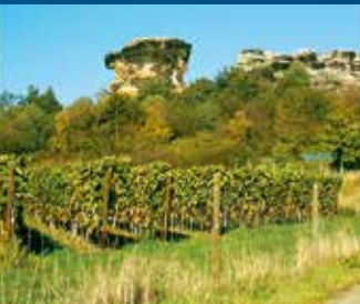
Weinbau am Königstein

Den Weinberg gibt es tatsächlich am Königstein; „Kamel“ ist im Volksmund die Bezeichnung des imposanten Felsens des Königsteins, dessen Silhouette an ein ruhendes Kamel erinnert. Wie der Schlossberg Quedlinburg, markiert der verhärtete Sandstein des Königsteins (190 m über NHN) die Südflanke des Quedlinburger Sattels. Die Sandsteine sind hier ebenfalls durch Kieselsäure imprägniert und infolgedessen „quarzitisch“ geworden, was eine beträchtliche Härte des Gesteins verursachte. Die wellige Oberfläche der Felswände kommt durch dünne verkieselte Adern und Zonen inhomogener Verfestigung zustande. Der Königstein war ein wichtiger Gerichtsort und ein Sonnenheiligtum. Im Faltblatt „Vom Königstein zur Königspfalz“ hat der Regionalverband Harz eine Wanderung quer über den Harz auf den „Wegen Deutscher Kaiser und Könige“ beschrieben, die hier ihren Ausgangspunkt nimmt.