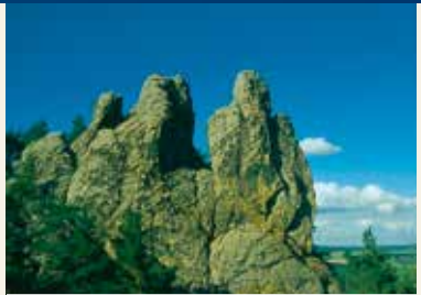
Felsgruppe „Hamburger Wappen“