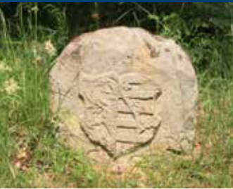
Wappen der Askanier (Anhaltiner)

Unweit von Friedrichsbrunn, an der Straße in Richtung Güntersberge, markiert eine Informationstafel des Regionalverbandes Harz ein früheres Dreiländereck. Dort trafen die Grenzen des Königreichs Preußen, des Herzogtums Anhalt und des Herzogtums Braunschweig aufeinander. In der Umgebung bis hin nach Thale sind zahlreiche Grenzsteine aus dem Zeitraum des 17. bis 19. Jh. zu entdecken, darunter kunstvoll gearbeitete Wappensteine.