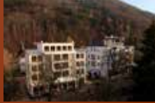
PLUMBOHMS Bio-Suiten Bad Harzburg www.plumbohms.de ☎ 05322 - 3277