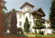
Hotel Winterberg Bad Harzburg www.solehotels.de ☎ 05322 - 96880