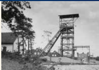
Fördererturm auf dem "Soldatenkopf"