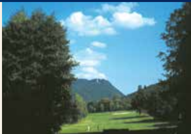
Blick zum Burgberg