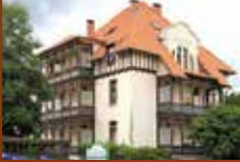
Vitalhotel am Stadtpark Bad Harzburg www.vitalhotel-am-stadtpark.de ☎ 05322 - 78090