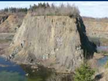
Steinbruch im Winter

Um uns auf die „Spur der Steine“, den seit 2016 bestehenden Rundweg um den Diabas-Steinbruch, zu begeben, wandern wir zunächst auf den Heimberg. Dort befindet sich nicht nur die Stempelstelle Nr. 109 der Harzer Wandernadel; Informationstafeln rahmen den malerischen Blick in den renaturierten Steinbruch ein. Was im Jahr 1885 als handwerklicher Betrieb begann, wandelte sich in den 1960-70er Jahren zu einem Betrieb mit einer Jahresproduktion von knapp 1 Mio. t. Bis 1986 wurde der wegen seiner hohen Druckfestigkeit und sehr guten Frostbeständigkeit für den Verkehrswegebau stark nachgefragte Rohstoff gewonnen. Entstanden war das grünliche Gestein vor etwa 380 Mio. Jahren untermeerisch aus in Tonschlamm eindringenden Magmen. Dank regelmäßiger Pflege ist der aufgelassene Steinbruch ein einzigartiger Lebensraum für seltene und geschützte Tier- und Pflanzenarten.