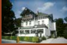
Hotel Tannenhof Bad Harzburg www.solehotels.de ☎ 05322 - 96880