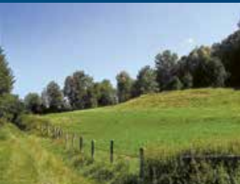
Halde bei Neuekrug

Bei Hahausen verlassen wir die B 82 und fahren auf der B 248 in Richtung Seesen bis zum Parkplatz zwischen Neuekrug und Einmündung der Kreisstraße nach Bornhausen. Wir gehen auf dem straßenbegleitenden Radweg 700 m zurück, weiter nach links den asphaltierten landwirtschaftlichen Weg und noch vor der Eisenbahnbrücke den grasbewachsenen Weg. Hier treffen wir die nördlichsten Ausläufer des Zechsteinzuges, der den Harz auf seiner Südseite begleitet. Dicht über der Basis des Zechsteins tritt Kupferschiefer auf, der Gegenstand des Bergbaus im Gebiet der Landmarken 12 und 17 war. Angeregt durch die wirtschaftlichen Erfolge im Mansfeldischen, versuchte man auch hier Kupferschiefer auszubeuten. Die geologischen Umstände und der geringe Metallgehalt führten aber zum Scheitern der "New Mansfield Copper and Silver Mining Company". Zurück blieben allein die Halden.