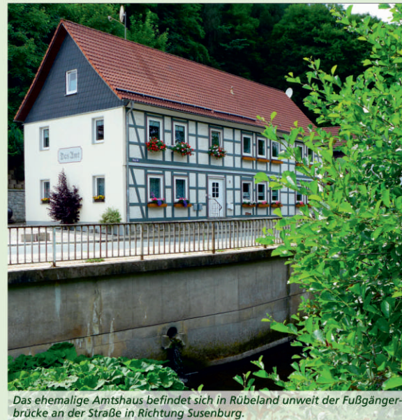
Das ehemalige Amtshaus befindet sich in Rübeland unweit der Fußgängerbrücke an der Straße in Richtung Susenburg.

Braunschweig-Wolfenbüttel zu einem Erbenzinshof um. Herzog LUDWIG RUDOLF VON BRAUNSCHWEIG UND LÜNEBURG (1671-1735) ließ 1734 in dessen Nähe ein kleineres Jagdschloss errichten. Einschließlich seiner Stallungen wurde es 1848 aufgegeben. Es folgte die Demontage des Jagdschlusses und des sogenannten Amtshauses. Ersteres wurde nach Halberstadt verkauft und dort wieder aufgebaut. Leider fiel es dem Zweiten Weltkrieg zum Opfer. Das Amtshaus jedoch steht noch heute im ebenfalls ehemals braunschweigischen Rübeland. Die Lange ist eine Wasserscheide III. Ordnung. Während die nördlich der Lange entspringenden Wasserläufe in die Kalte Bode münden, fließen die südlich gelegenen in die Rappbode.