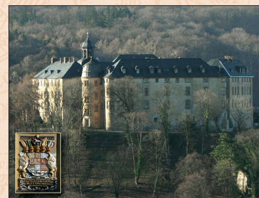
Großes Schloß Blankenburg