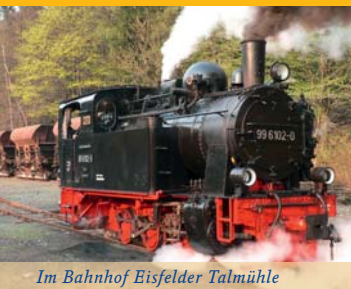
Im Bahnhof Eisfelder Talmühle

Kriege. Besonders im Jahr 1806, nach der Schlacht bei Jena und Auerstedt, flüchteten die geschlagenen Preußen und Sachsen in den Harz, verfolgt von einer großen Anzahl Franzosen. Diese quartierten sich zum Teil bis zum Jahr 1813 in Stiege und Umgebung ein und nahmen der Bevölkerung noch das Letzte. Es folgte eine wechselvolle Geschichte an deren Ende das Schloss Stiege an „Bürgerliche“ verkauft wurde. Vor dem Zweiten Weltkrieg gehörte es einem Brasilianer, der aus einer Braunschweiger Familie stammte. Nach dem Krieg wurde das Schloss enteignet, es war fortan „Volkseigentum“ der DDR. Saniert, erhalten und genutzt wurde es kaum. Das änderte sich leider auch nach der Wiedervereinigung nicht. Bis zum Jahr 2005, da erwarb ein Holländer das altherwürdige Gemäuer oberhalb des idyllischen Stieger Sees.