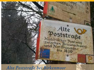
Alte Poststraße bei Birkenmoor

Knapp 700 m weiter, besteht die Möglichkeit, einen kleinen Abstecher zur Talsperre Neustadt zu machen. Die im Jahr 1905 in Betrieb genommene Talsperre besitzt die älteste Staumauer Thüringens und versorgt die Orte Neustadt und Nordhausen mit Trinkwasser. Die ursprüngliche Höhe der Talsperrenkrone von 27 m wurde im Jahr 1923 nochmals um 5 auf 32 m erhöht, um ein größeres Stauvolumen erreichen zu können. Durch den Bau der Talsperre Anfang des 19. Jh. konnte die große Wasserbautradition des Harzes wiederbelebt werden. Zurück von unserem kleinen Abstecher folgen wir wieder der goldenen Krone, bis wir an eine Schranke kommen. Diese umgehen wir und laufen weitere 1,5 km durch dichten Laubwald bis zur nächsten Kreuzung. Hier biegen wir rechts ab, verlassen die „Alte Poststraße“ und laufen hinab Richtung Burg Hohnstein. Dem schmalen Pfad folgend, erreichen wir nach weiteren 1,5 km den Fuß der Burgruine Hohnstein, die wir bisher nur erahnen konnten. Hier finden wir die zweite Info-Tafel auf dem Abschnitt von Stiege nach Nordhausen. Sie gibt Auskunft über die Südhartzburgen und das Wegenetz. Die Burgruine bildet das Ende der zweiten Etappe auf unserer Reise nach Nordhausen.