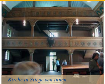
Kirche in Stiege von innen

auf den weiteren Kilometern ändert, ist die Beschaffenheit und die Art des Weges sowie die Arten der Bäume. Aber genau das macht es für den Wanderer ja so spannend. Wo anfangs noch Nadelbäume den geschotterten Weg umgeben, sind es nachfolgend meist Laubbäume – in der Regel Rotbuchen, welche dann rechts und links des Pfades eine wunderbare Atmosphäre schaffen. Das Ganze wird im Verlauf des Weges noch abgerundet mit Bachüberquerungen und interessanten Pfaden durch Hohlwege hindurch. Die letzten knapp 1,3 km bis Birkenmoor geht es dann nahezu gradeaus, die „Alte Heerstraße“ entlang, welche links und rechts wieder von Nadelwald umgeben ist. Gerade dieser Wechsel zwischen Laubwaldbestand und Nadelwald macht die erste Etappe von Stiege bis nach Birkenmoor so erlebenswert für Wanderfreunde.