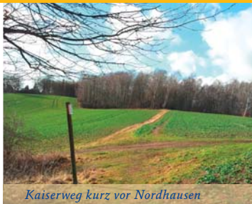
Kaiserweg kurz vor Nordhausen

des „Marktflecken“ Neustadt. Den Titel „Marktflecken“ erhielt Neustadt 1485 mit den wichtigsten Stadtrechten vom Grafen zu Stolberg. Lange war es ein ungeschriebenes Gesetz, dass jeder verstorbene Bürger Neustadts durch das „Alte Tor“ zum Friedhof getragen oder gefahren wurde. Auf dem Tor wohnte in den letzten zwei Jahrhunderten der Nachtwächter. Es war seine Aufgabe, nachts an bestimmten Stellen des Ortes durch Blasen ins Horn und Ausrufen jeweils die volle Stunde anzuzeigen. Seit 1998 ist der Harzklub-Zweigverein Neustadt/Osterode tätig, um die Räumlichkeiten auf dem „Alten Tor“ in einer Heimatstube mit musealem Charakter auszugestalten. Nachdem wir nun das „Alte Tor“ durchschritten haben, überqueren wir schräg rechts die Straße, kommen auf den großen Parkplatz, welcher ebenfalls überquert wird und folgen weiter der goldenen Krone und den Schildern Richtung Rüdigsdorf bis zur Neustädter Wetterfahne. Von dort aus geht es wieder bergab; wir queren zwei Äcker. Dann heißt es rechts abbiegen auf einen Schotterweg, den wir nach weiteren knapp 400 m linker Hand verlassen. Von hier aus geht es am Waldrand entlang, bis der Weg nach rechts abzweigt und sehr steil nach oben durch ein Waldstück führt. Oben angekommen blicken wir auf eine