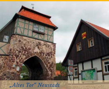
„Altes Tor“ Neustadt

M it der Burgruine im Rücken folgen wir der goldenen Krone und den Wegweisern Richtung Neustadt. Nach etwa 500 m erreichen wir den Neustädter Gondelteich. Dieser lädt zu jeder Jahreszeit zum Verweilen ein. Anschließend folgen wir der Burgstraße. An ihrem Ende treffen wir auf den hölzernen Roland, welcher als Gerichtszeichen der Stadt im Jahre 1730 erneuert wurde. Der erste Roland sowie große Teile der Altstadt und das städtische Archiv waren im Jahr 1678 einem Brand zum Opfer gefallen. Das Besondere am Neustädter Roland ist die Schwurhand und auch das Fehlen des erhobenen Richtschwertes in der rechten Hand. Dieses steckt noch in der Schwertscheide. Vermutlich soll damit an die Umstände erinnert werden, dass die Stadt keine älteren Rechtsbelege in Form von Urkunden mehr vorweisen kann. An dieser Stelle schlängelt sich der Weg weiter durch den Ort. Wir gehen durch das um 1450 erbaute „Alte Tor“. Es war das Haupttor