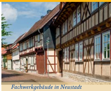
Fachwerkgebäude in Neustadt

Sie liegt inmitten eines Waldgebietes und ist öffentlich zugänglich. Die Ilburg bei Ilfeld ist zwar weitgehend unbekannt, trotzdem kann sie als eine Harzer Dynastenburg angesehen werden. Als „castrum Yleborgh“ wurde die Burg um 1150 vom Grafen ELGER I. VON BILSTEIN auf einem freistehenden kleinen Bergkegel südlich der Ortslage von Ilfeld erbaut. Sein Sohn und Nachfolger ADELGER VON ILFELD vermählte sich um 1162 mit LUTRUDE VON HOHNSTEIN und gelangte so in den Besitz der Burg Hohnstein. Etwa um 1180 verlegten ADELGER und LUTRUDE ihren Wohnsitz von der kleinen Ilburg auf die große benachbarte Burg Hohnstein und änderten ihren Namen in „von Hohnstein“. Das Paar gilt damit als Begründer der Grafendynastie von Hohnstein. Mit der Übersiedlung des Grafenpaars wurde die Ilburg nach nur etwa 80 Jahren aufgegeben. Der Legende nach gründete das Grafenpaar nach seiner glücklichen Rückkehr von einer Pilgerreise nach Jerusalem 1189 das Kloster Ilfeld. Als Baumaterial für das weithin bekannte Kloster, das mit Unterstützung des Klosters Pöhlde errichtet wurde, sollen die Steine der Ilburg gedient haben. Trotzdem sind bis heute Reste dieser hochmittelalterlichen Burganlage erhalten geblieben.