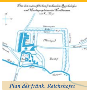
Plan des fränk. Reichshofes