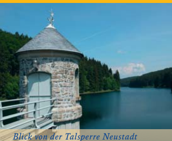
Blick von der Talsperre Neustadt

A uf den folgenden knapp 8,5 Kilometern bewegen wir uns auf alten Poststraßen und anderen Pfaden überwiegend durch Laubwälder. Anfangs geht es auf der „Alten Poststraße“, welche bis zum Jahr 1820 auch als solche zwischen Braunschweig und Nordhausen genutzt wurde, ein paar hundert Meter durch Nadelwaldbestand. Die ersten Tausend recht mühelos zu bewältigenden Meter geht es leicht bergab, parallel zu einem kleinen Bachlauf bis an eine große Wegkreuzung. Dort queren wir den Bach und begeben uns einen steilen Anstieg, der „Alten Poststraße“ folgend, hinauf. Für Wander- und Naturfreunde ein traumhafter Abschnitt, der sich durch einen Hohlweg, gesäumt von Nadelhölzern, zieht. Im weiteren Verlauf folgen wir immer der goldenen Krone, bis wir einen mächtigen Bergahorn erreichen. Der Baum hat sicher schon einige Jahrzehnte miterlebt.