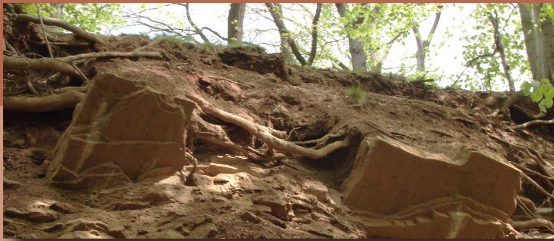
Die Erdgeschichte des Geoparks Harz · Braunschweiger Land · Ostfalen