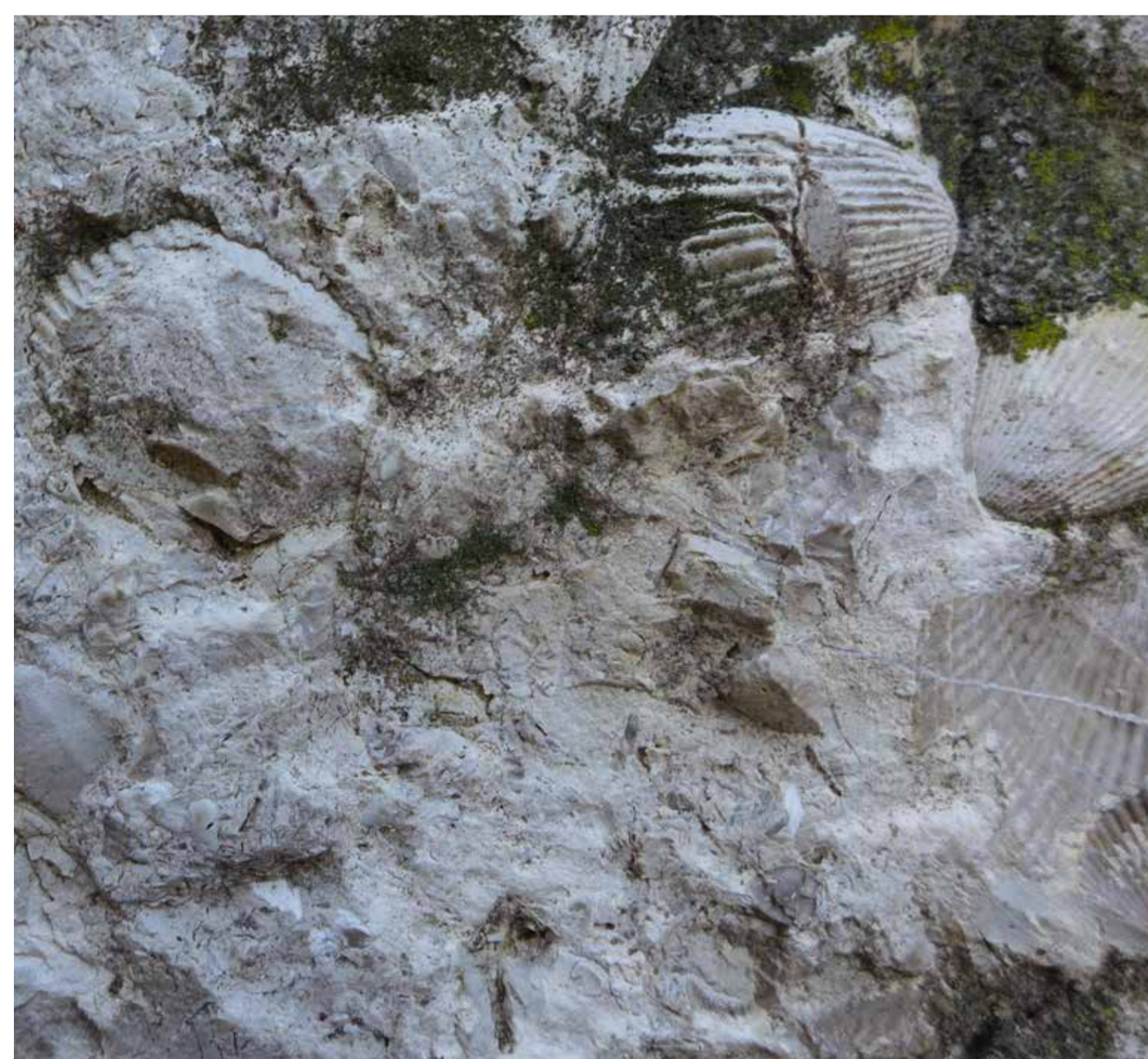
Muschelkalk (Mauer in der Burgstraße)