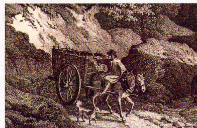
Einrätiger Kohlenkarren mit geflochtenem Korb

Meter für Meter mühen sich die Karren voran. Tief graben sich beide Räder ein, hinterlassen Spuren selbst im Felsgestein. Er kennt das Gelände. Trotzdem: Der steile Hohlweg macht ihm zu schaffen! Seine wertvolle Fracht bringt der Fuhrmann in die Mansfelder Kupferhütten.