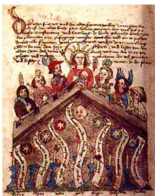
Darstellung der sieben freien Künste im Tübinger Hausbuch

Den praktischen Künsten ließ sich das Handwerk, aber auch die Agrikultur zurechnen. Landwirtschaft war immer ein Kampf gegen die Natur, anfangs geführt mit Hakenpflug und Hacke, heute meist unter Anwendung von Pflanzenschutzmitteln. Als freie Künste hingegen galten die Studienfächer Grammatik, Rhetorik, Dialektik, Arithmetik, Geometrie, Musik und Astronomie. Nur wer zum Broterwerb nicht körperlich arbeiten musste, galt schon in der Antike als frei und konnte sich mit einer der sieben Künste beschäftigen.