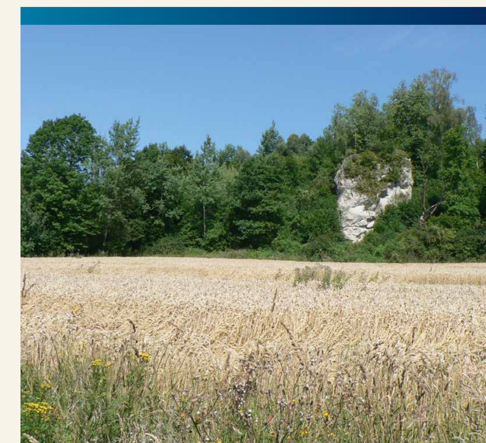
Römerstein südlich von Steina