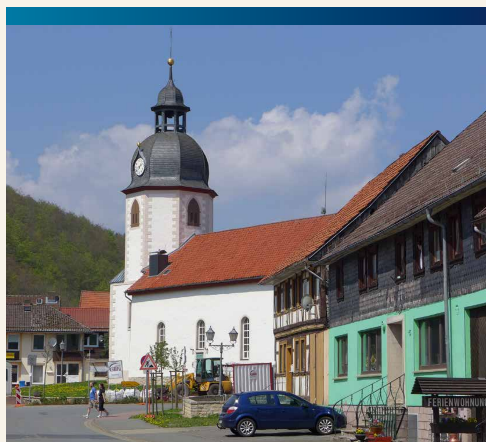
1712 erbaute Katharinen-Kirche