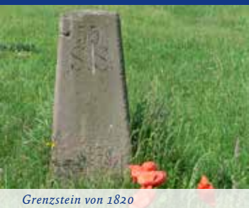
Grenzstein von 1820

N ach Auleben geht's wieder hinauf. Nein, was vor uns liegt ist nicht alpin! Allein in Deutschland gibt es 67 mal die Bezeichnung Schweiz. Schon THEODOR FONTANE († 1898) spottete über die seinerzeitige Mode, hügelige Landschaften mit dem Synonym des Alpenlandes zu belegen. Es ist eine heute noch verfängliche Marketingstrategie. Steht doch die Schweiz ganz allgemein für landschaftliche Schönheit, Wohlstand, Unabhängigkeit und ein wohlorganisiertes Staatswesen. Wir erklimmen die Badraer Schweiz und passieren auch gleich eine alte Staatsgrenze: die zwischen Preußen und dem Freistaat Schwarzburg-Sondershausen (S.S.). Letzterer ging 1918 aus dem gleichnamigen Fürstentum hervor und bestand bis zum 30. April 1920. Tags darauf wurde das Land Thüringen gegründet. In Badra gibt es eine sehenswerte Sammlung historischer Grenzsteine.