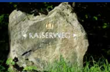
Stein auf dem Burgberg