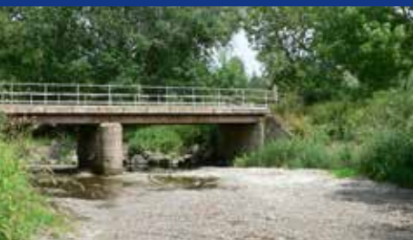
Wiedabrücke bei Woffleben

D as zeitweilig trockene Flussbett der Wieda erinnert uns daran, dass wir durch ein Karstgebiet wandern. Vor Nordhausen führt der Kaiserweg unmittelbar an der KZ-Gedenkstätte Mittelbau-Dora vorbei. Nordhausen wurde bei einem Luftangriff im April 1945 weitgehend zerstört. Dennoch lohnt die Stadt einen Besuch. Die Endung „-hausen“ lässt auf eine fränkische Gründung im 8. Jh. schließen. Nordhausen selbst wurde am 13. Mai 927 in einer Schenkungsurkunde HEINRICHS I. († 936) an seine Frau MATHILDE († 968) erstmals urkundlich erwähnt. Ein Frauenstift hatte MATHILDE zu jener Zeit ebenda gegründet, während ihr Sohn OTTO I. (912-973) nach Rom unterwegs war, um vom Papst die Kaiserkrone zu empfangen. 1220 wandelte Kaiser FRIEDRICH II. († 1250) das Frauen- in ein reichsunmittelbares weltliches Chorherrenstift um. Münze und Zoll unterstellte er direkt dem Reich.