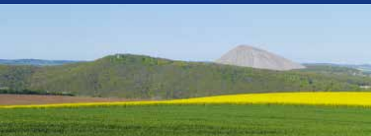
Blick vom Kaiser-Otto-Höhenweg auf die Spitzkegelhalde Hohe Linde

Im Schulterschluss mit den örtlich zuständigen Zweigvereinen des Harzklubs und in Umsetzung der Pflege- und Entwicklungskonzeptionen des Naturparks „Harz/Sachsen-Anhalt“ bzw. mit Förderung aus dem Programm „Natur erleben in