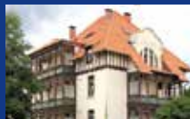
Vitalhotel am Stadtpark Bad Harzburg www.vitalhotel-am-stadtpark.de ☎ 05322 - 78090