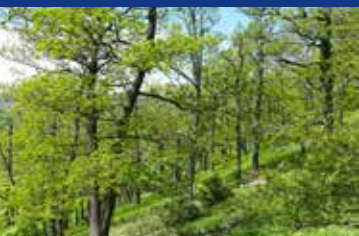
Eichen am Burgberg