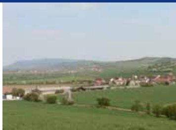
Blick über Hamma zum Kyffhäuser