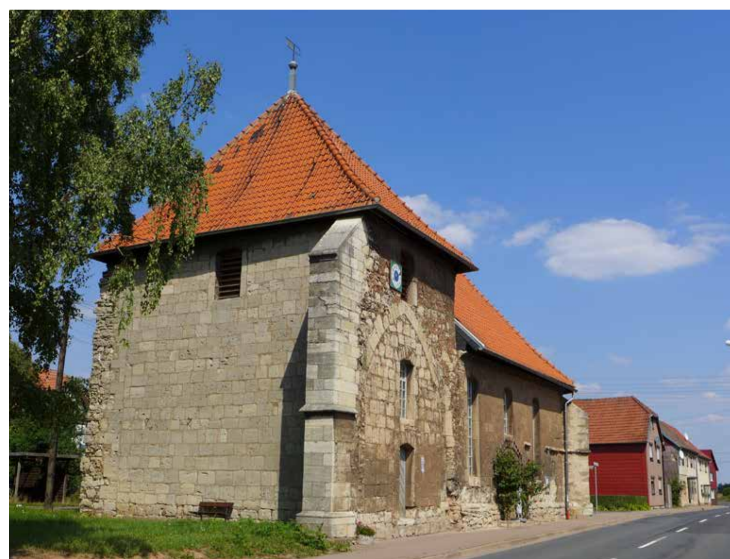
Frühere Wallfahrtskirche Sankt Marien in Elende Former pilgrimage church of St. Mary in Elende

nearby wayside chapel (constructed ca. 1300). The quarries were located in the northwestern area of the shell limestone hills surrounding the Thuringian basin, among which are the Hainleite and Duen ranges.