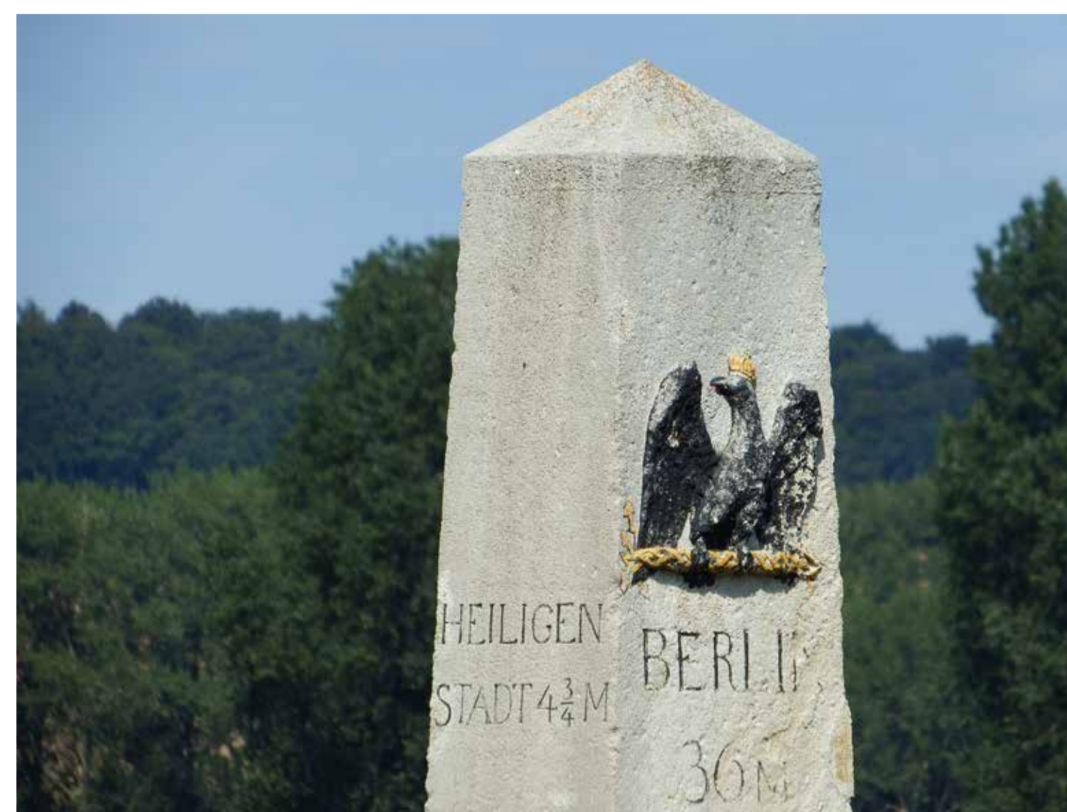
Teilansicht des Ganzmeilenobelisk an der Halle-Kasseler-Straße Partial view of the Prussian milestone on Halle-Kasseler-Strasse

schwerer Krankheit, sind im sogenannten Mirakelbuch für die Zeit zwischen 1419 und 1517 dokumentiert. Schutz fanden die Pilger in der Wegekappelle bzw. im Vorgängerbau des Hospitals „Maria im Elende“ hier am heutigen Ortausgang. Der Zusatz „im Elende“ weist darauf hin, dass sich Hospital und Kapelle ursprünglich außerhalb des Dorfes befanden. Im Althochdeutschen steht eilenti für „ferner, abgelegener Ort“. Die Wegekappelle ist Geopunkt 3 im Gebiet um die Landmarke 21 des UNESCO-Geoparks. Erbaut wurde die Kapelle um 1300 vorwiegend aus Muschelkalk . Dieser stammt aus Steinbrüchen der nahegelegenen Höhenzüge Hainleite oder Dün. Beide sind Teil der nordwestlichen Muschelkalkumrahmung des Thüringer Beckens. Auch roter Sandstein ist in Mauern zu entdecken. Buntsandstein wurde nördlich von hier abgebaut, so auch im Steinbruch Kehmstedt (Geopunkt 13). Buntsandstein- und Muschelkalklager entstanden im Erdmittelalter vor mehr als 200 Mio. Jahren (Trias).