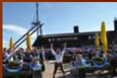
Wurmberg Alm Braunlage www.wurmberg-alm.de