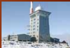
Brockenhotel Schierke www.brockenhotel.de