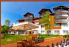
relexa hotel Harz-Wald Braunlage www.relexa-hotel-braunlage.de