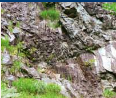
Granitkontakt på Goetheplatz

intrusion. Ældre sedimentbjergarter, der er omdannet til hornfels, ligger her oven på den senere indtrængne granit. Her blev GOETHE i 1783 bestyrket i sin fejlagtige tro, at granit er en neptunsk bjergart fra oldtiden. På Grabenweg kan man se ned i den dybe Oderdal. På skråningen overfor ses et hav af stenblokke. I dalbunden tyder forekomster af moræneaflejringer, lag af nedbrudt materiale samt silt og sand fra et vandreservoir på, at der har været små gletsjere i nogle af Harzens dale i Pleistocæn. Vi fortsætter til nationalparkens skovkro Rehberger Grabenhaus. Bygningen blev bygget i 1772 som bolig for den såkaldte "Grabwächter", som var ansvarlig for vedligeholdelse af vandanlæggene. Herfra går vi over Jordanshöhe på en læresti, hvor der er udstillet forskellige bjergarter, og kommer til minebyen Sankt Andreasberg, der i dag er en bydel i byen Braunlage. Hvert år i september/oktober afholdes her kunst-udstillingen "Natur – Menneske".