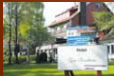
Hotel „Zum Forsthaus“ Altenau www.hotel.zum.forsthaus.harz.de