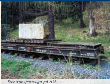
Stentransportvogn på HSB

forvitring, at man kan se igennem. Kort tid efter når vi også "Ottofelsen". Trapper fører op på granitplateauet. Vi har her en vidunderlig udsigt til Bloksbjerg og Harzens forland.