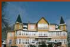
Hotel Brockenscheideck Schierke www.hotel-brockenscheideck.de