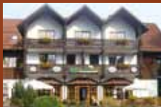
Restaurant Grimbart's Braunlage www.hapimag.com