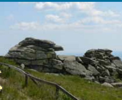
Teufelskanzel og Hexenaltar

Udstillingen i Brockenhaus, der er værd at besøge i al slags vejr, tager os med på en magisk (tids-) rejse til