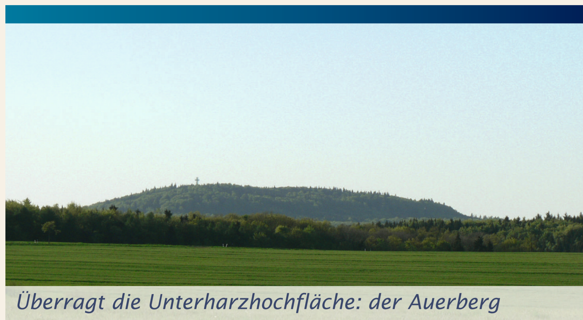
Überragt die Unterharzhochfläche: der Auerberg

Eng verbunden mit der Plattentektonik (siehe Tafel „Eine geologische Zeit- und Fernreise“) ist der Vulkanismus. An Plattengrenzen kann aufgeschmolzenes Gesteinsmaterial zur Erdoberfläche gelangen und Vulkane bilden. So ereignete es sich auch in der Rotliegend-Zeit im Perm vor ca. 300 – 270 Mio. Jahren. Damals lag der Harz noch in der Nähe des Äquators.