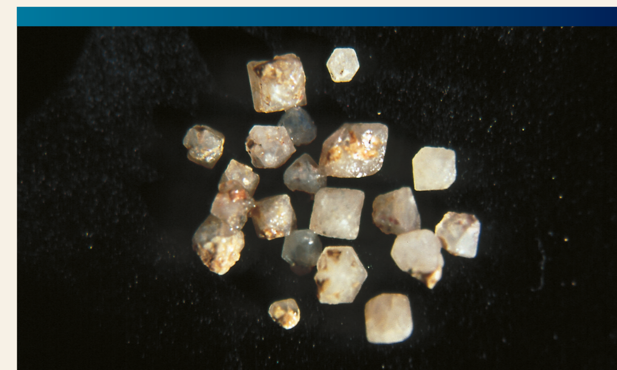
Freigespülte Stolberger Diamanten

Durch die weitere Verwitterung des Rhyoliths bleiben schließlich Feldspat- und Quarzkristalle zurück. Sie werden nach der naheliegenden Stadt der Gemeinde Südharz „Stolberger Diamanten“ genannt. Es sind bis zu 8 mm große, rosafarbene Feldspatminerale und bis zu 13 mm große, auskristallisierte Quarze. Während sich ein Teil der Gesteinsschmelze dicht unter der Erdoberfläche langsam abkühlte, konnten sie zu dieser Größe heranwachsen. Erst durch Ausbruch des Vulkans wurden sie an die Erdoberfläche herauskatalpultiert. Besonders nach Regentagen lassen sich die „Stolberger Diamanten“ leicht am Wegesrand entdecken. Versuchen Sie Ihr Glück und begeben Sie sich auf die Suche nach den „Diamanten“!