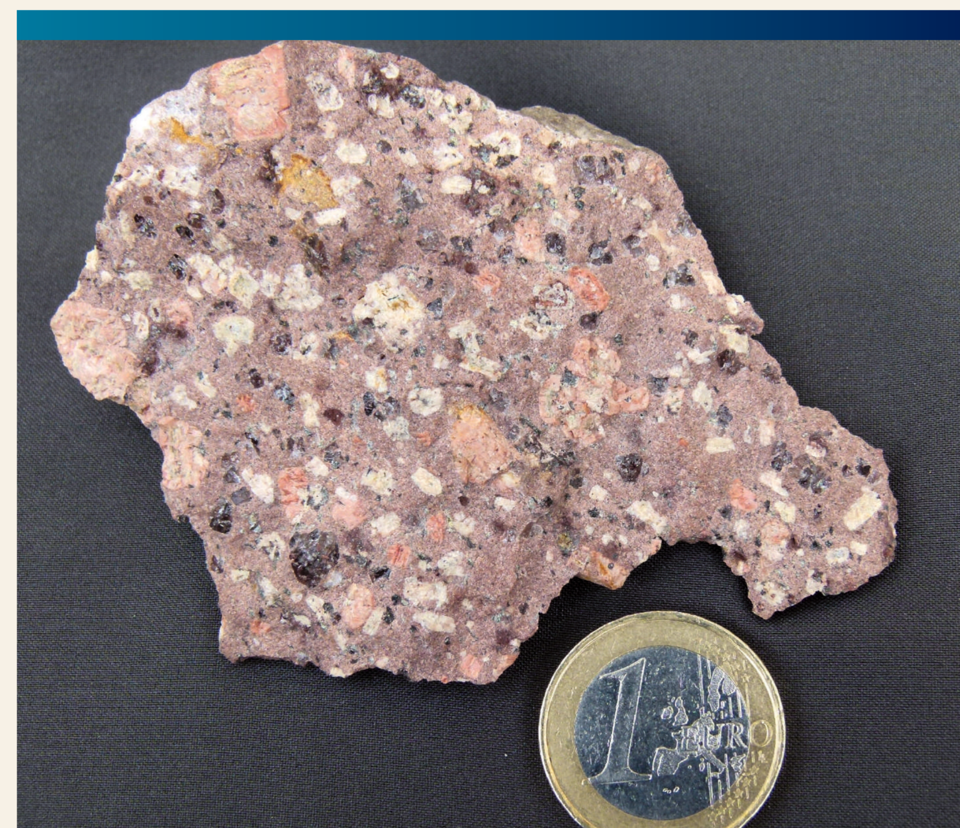
Rhyolith (Löbejüner Porphyry)

Heute sind diese Schichten jedoch weitgehend abgetragen. Als Erosionsrest ist Rhyolith erhalten geblieben, das prägende Gestein am Auerberg. Es ist ein quarzreiches, sehr widerstandsfähiges Vulkangestein, das nur sehr langsam verwittert.